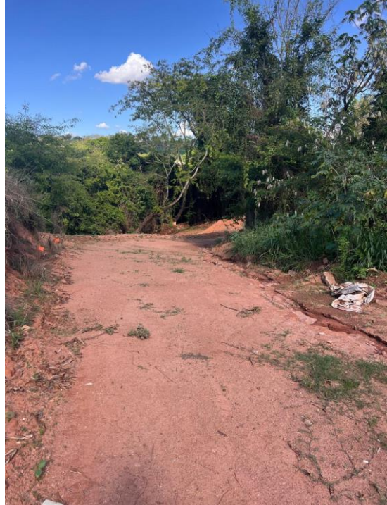
Figura 4. Local a ser executado a obra.