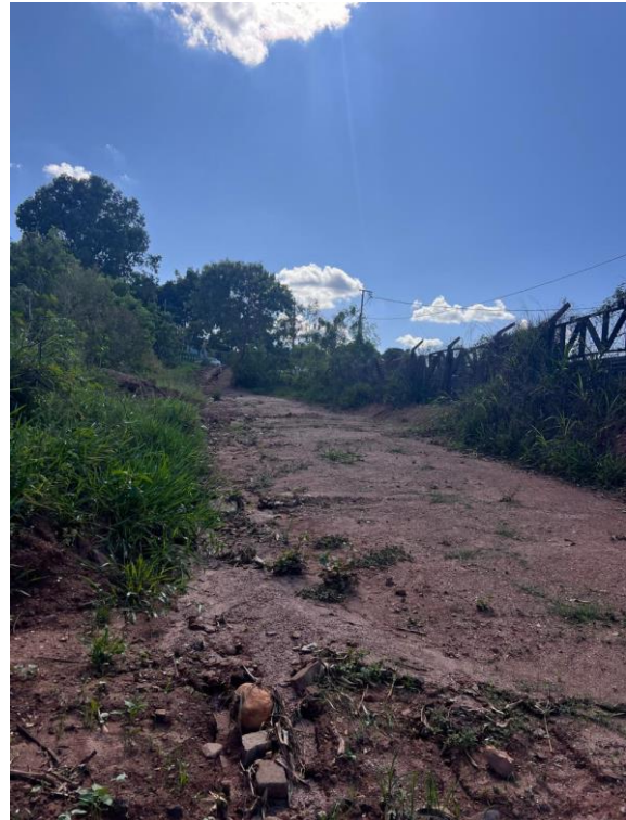
Figura 6. Local a ser executado a obra.