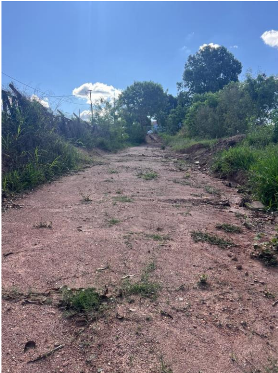
Figura 5. Local a ser executado a obra.