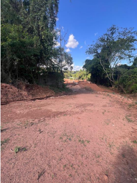
Figura 3. Local a ser executado a obra.