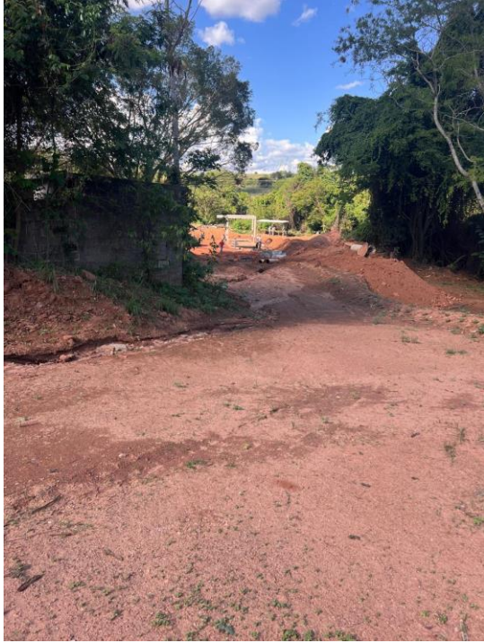
Figura 1. Local a ser executado a obra com vista da EEE São Domingos ao Fundo.